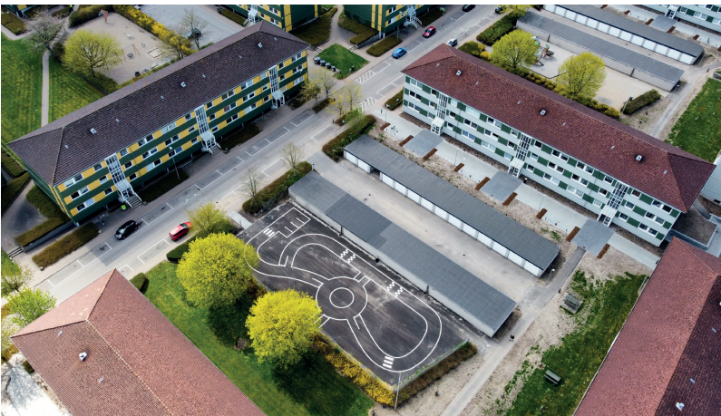
Trafikkørebanelen ved Husarvej er klar til leg

Snart vil arbejdet på det centrale aktivitetsområde desuden være i fuld gang. Her vil der hen over sommeren blandt andet blive anlagt en padeltennisbane og en multibane. Men både rådgiver og projektleder beder børnene om at væbne sig med lidt tålmodighed, så længe området stadig er en bygge- og arbejdsplads, selvom det kan være svært at vente.