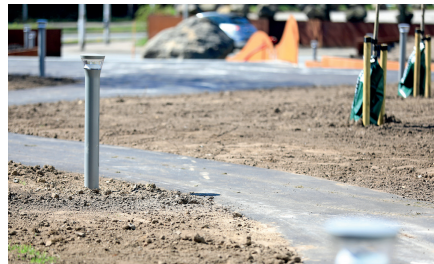
Stien ved Jennumporten er asfalteret