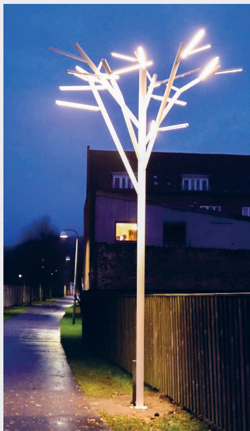
Nogenlunde sådan kommer de lysende træer til at se ud.