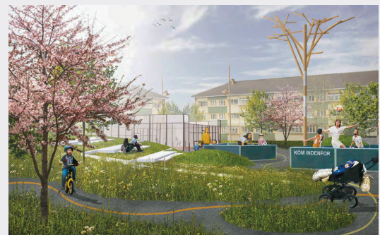
Visualisering af aktivitetsområde.

Infrastrukturprojektet skal medvirke til at skabe en positiv identitet i boligområdet blandt andet ved at åbne området for omverdenen og knytte det sammen med den omkringliggende by og natur. Projektet omfatter blandt andet nye stiforbindelser, øget belysning, aktivitetsområder for alle aldersgrupper og ny varieret beplantning. Projektet er finansieret af Landsbyggefonden og blev i efteråret 2020 godkendt af beboerne på afdelingsmøder i de fem involverede afdelinger.