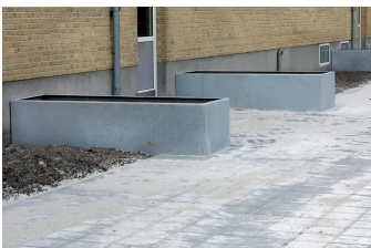
Belægning og blomsterkasser.