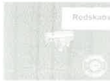
Redskabsskur/stålskab 1,47x0,86x1,34m ProShed®, Antracit Højde: 1,34m